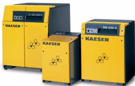
Soffianti rotative con PROFILO OMEGA