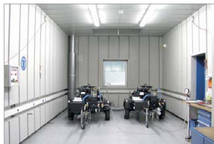
Mobilair in camera di collaudo

Lo stabilimento di produzione dei motocompressori KAESER a Coburg