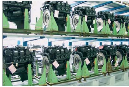
Stock di motori in attesa di assemblaggio