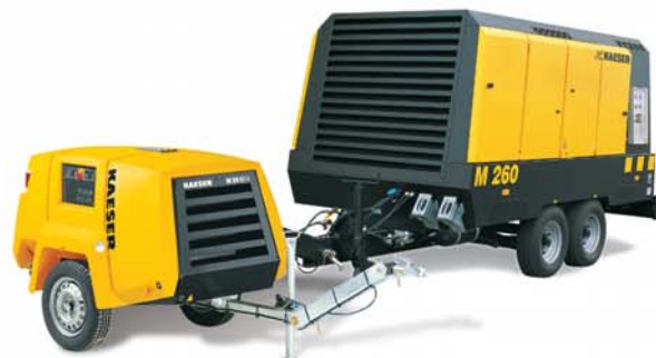
Motocompressori da cantiere con PROFILO SIGMA