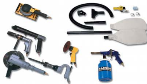
Utensili pneumatici ed accessori