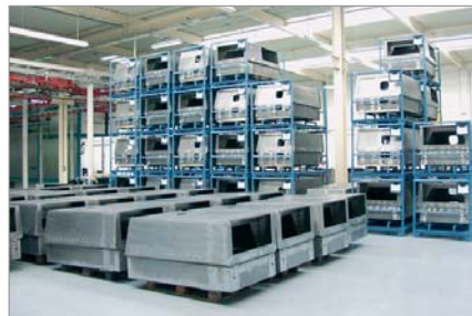
Nel reparto carrozzeria prende forma la sagoma dei motocompressori