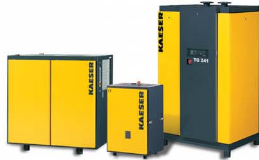
Essiccatori a ciclo frigorifero con regolazione a risparmio energetico SECOTEC