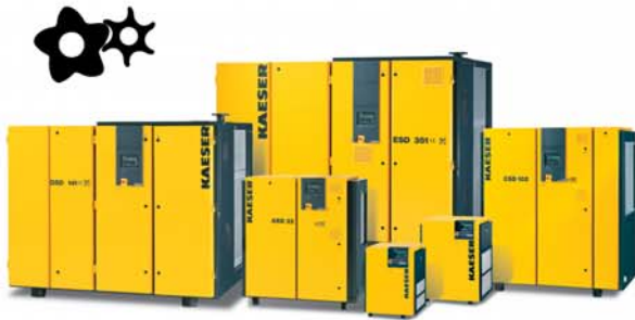
Compressori a vite con PROFILO SIGMA