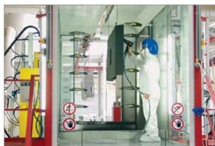
Nell'impianto di verniciatura a polveri si fissa il colore alle macchine