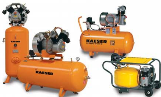
Compressori a pistoni per aziende artigiane ed officine